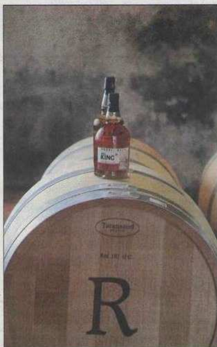
À consommer avec modération.

Domaine de Rimauresq, Route Notre-Dames-des-Anges, 83790 Pignans. Ouvert de 9 h à 12 h et de 15 h à 18 h. Rens. 04 94 48 80 45. Site internet : www.rimauresq.fr