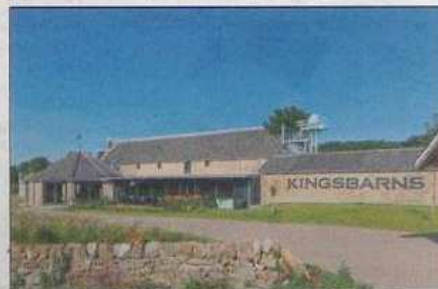
Deux domaines différents pour une même passion. À gauche, Rimauresq et ses vignes et à droite, la distillerie artisanale à Kingsbarns, dans le comté de Fife.