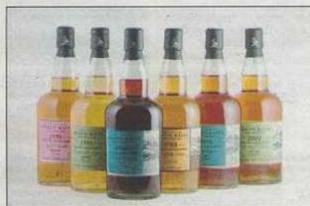
Les fameux Wemyss Malts, à partir de 100 euros.